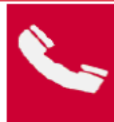
Τηλέφωνο για την καταπολέμηση πυρκαγιών

Όταν πρέπει να δείξουμε την κατεύθυνση που πρέπει να ακολουθήσουμε για να φτάσουμε στον πυροσβεστικό εξοπλισμό τότε τα αντίστοιχα σήματα συνδυάζονται ανάλογα με τα παρακάτω σήματα κατεύθυνσης